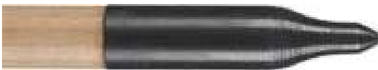
Klebspitze 3 D