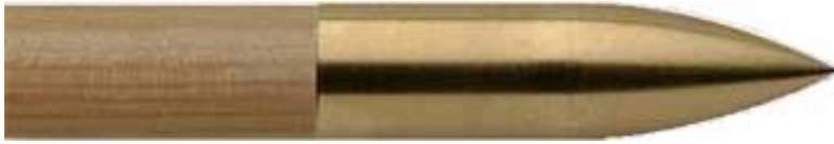
Top Hat Bullet Messing/Stahl

Pfeilspitzen, die bei hessischen Meisterschaften zugelassen sind.